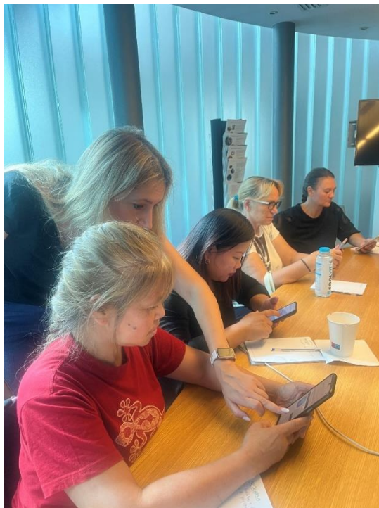
Εικόνες από τα εργαστήρια επικύρωσης στην Ελλάδα.