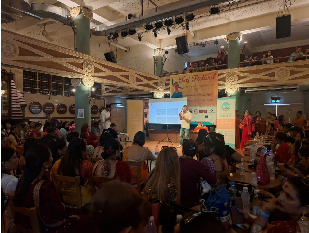
Εικόνα από την ενημερωτική ημερίδα στην Κύπρο

Στο πλαίσιο του έργου, πραγματοποιήθηκαν 6 ενημερωτικές ημερίδες, μία σε κάθε χώρα της κοινοπραξίας: Ιταλία, Γαλλία, Γερμανία, Ισπανία, Κύπρο και Ελλάδα. Πάνω από 550 άτομα παρακολούθησαν αυτές τις εκδηλώσεις.